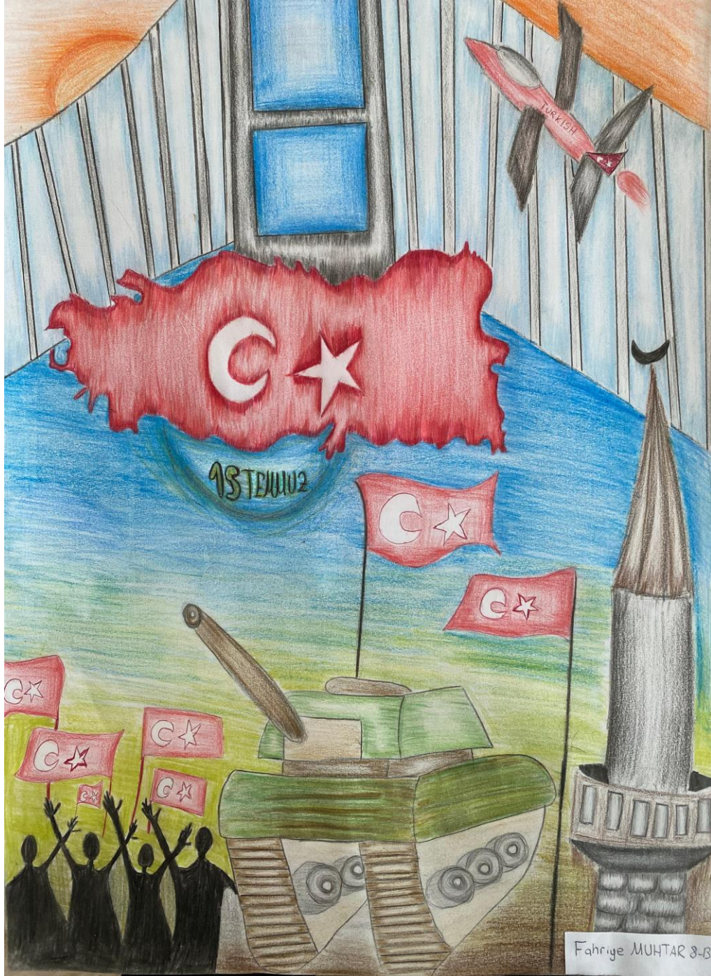
Fahriye MUHTAR 8-B